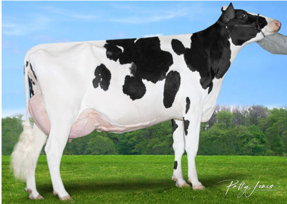
MORNINGVIEW DUKE ZIP GRANDDAM