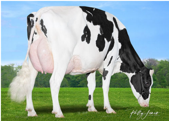
MORNINGVIEW DUKE ZIP GRANDDAM